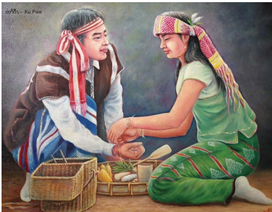
တၢ်ပိၤ - Ku Paw